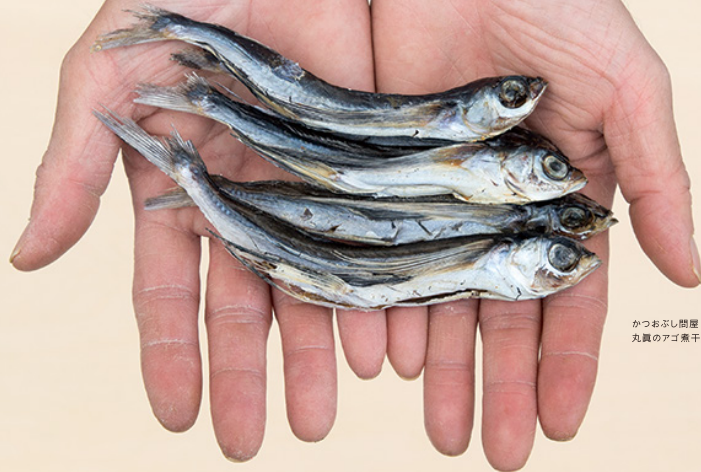
かつおぶし関連 丸真のアゴ煮干し